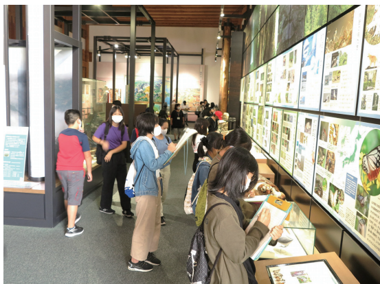
令和2年撮影 / 常設展示室