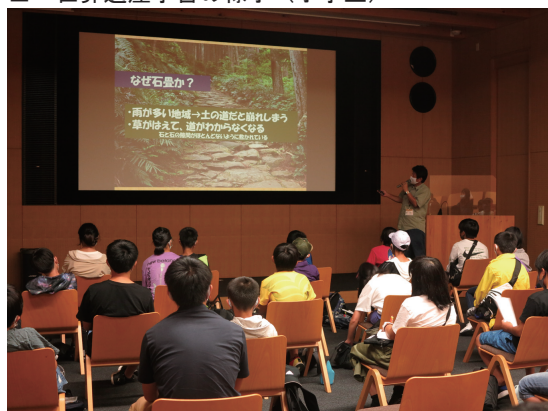
令和2年撮影 / 映像ホール