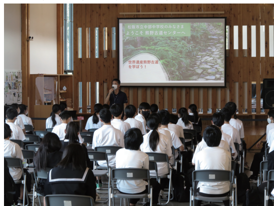
令和2年撮影 / 大ホール